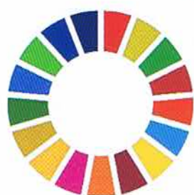
SDGsのシンボルマーク