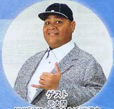
ゲスト 元夫関 NHK「にほんごであそぼ」出演中 小錦八十吉