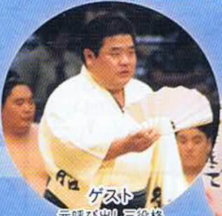
ゲスト 元呼び出し三役格 佐渡ヶ嶽部屋出身